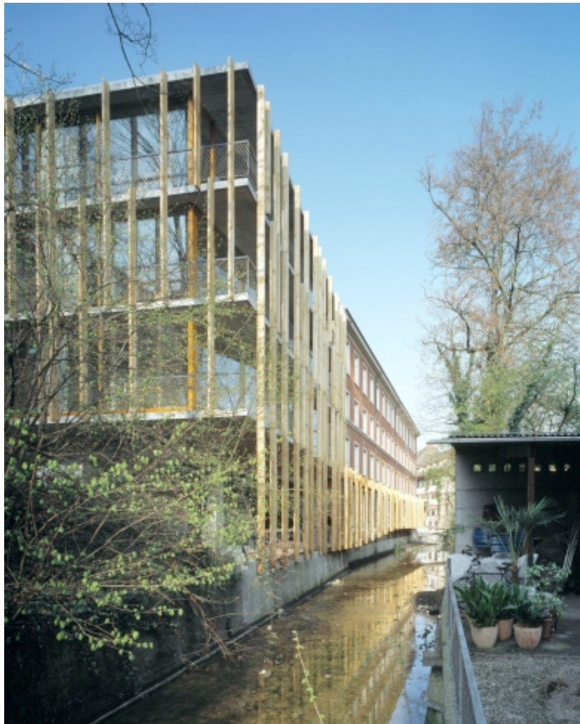
Jugendherberge St. Alban, Basel, «Hölzerne Klammer»