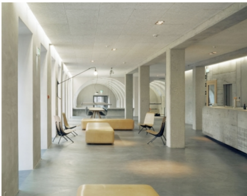
Jugendherberge St. Alban, Basel, «Unveredelte Materialien»

Im direkten Sinne hat die unmittelbare Umgebung von Grünraum und Bach und deren besondere Qualität den Entwurf massgeblich beeinflusst.