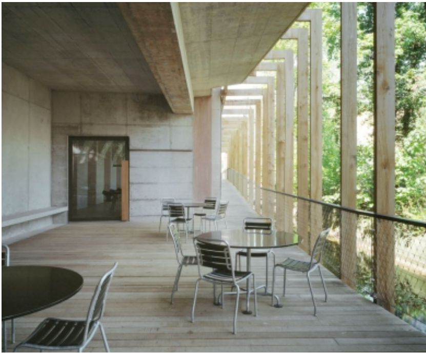
Jugendherberge St. Alban, Basel, «Terasse»