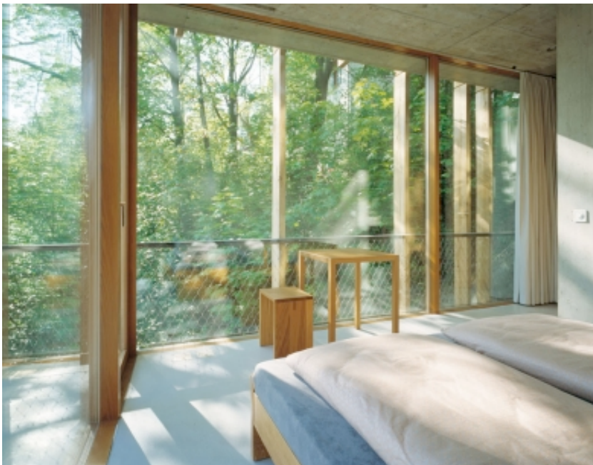
Jugendherberge St. Alban, Basel, «Innen-Aussen»

Wir freuen uns über Ihre Anregungen und Kritiken!